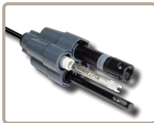
Portasonde multiplo: elettrodi a tenuta stagna con 3 metri di cavo

Comandi chiari e intuitivi, tenuta stagna secondo gli standard IP67 e tecnologia di comunicazione wireless.