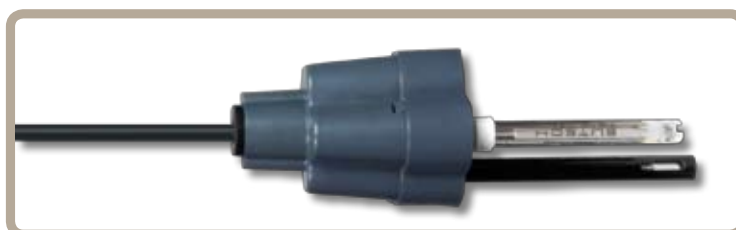
Portasonde multiplo: elettrodi a tenuta stagna con 3 metri di cavo