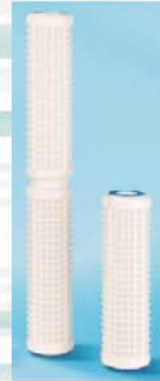
Cartucce lavabili Washable cartridges