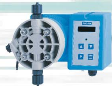
Pompe dosatrici serie GMS Portate da 1 a 100 l/h Pressione max 20 bar