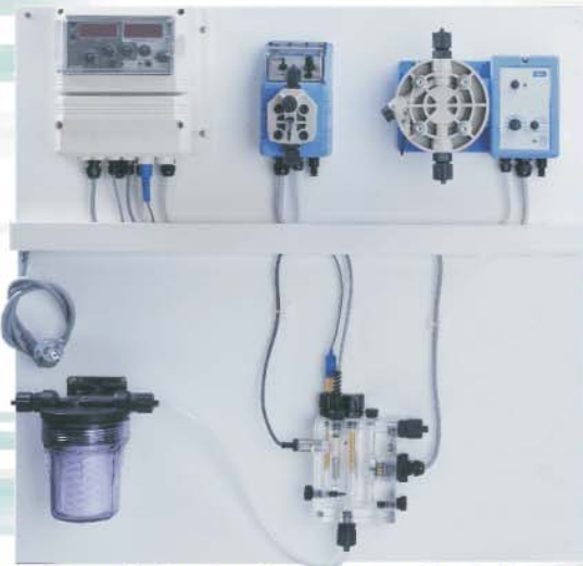
Impianto per il dosaggio e controllo della clorazione con lettura diretta in mg/litro del cloro libero. Strumento LDCL con uscite digitali per telecontrollo System for dosage and control of chlorination with direct mg/lit. reading of free chlorine. LDCL instrument with digital outputs for remote control