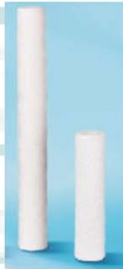
Cartucce a perdere Throw - away cartridges