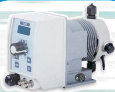
Pompe dosatrici serie HMS Portate da 1 a 16 l/h Pressione max 20 bar