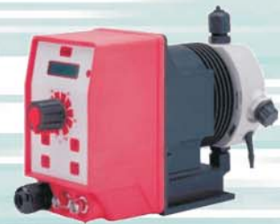
HMS RH Digital metering pump for chlorine with integrated Redox (mV) instrument, equipped with Redox probe