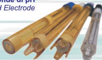
Sonde di pH pH Electrode