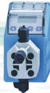
FMS Series metering pumps Flow rates from 1,5 to 10 l/h Max. pressure 12 bar