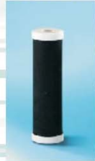
Cartucce a carbone attivo sinterizzato Trattamento anticloro Sintered carbon cartridges Anti - chlorine treatment