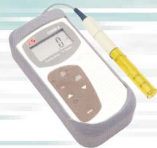
Conduttimetri Conductivity meters