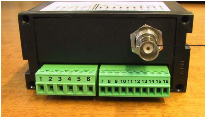
Connettore "BNC" per sonda pH