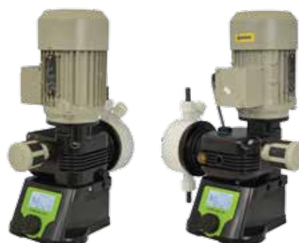
TÊTE DE POMPE EN PP